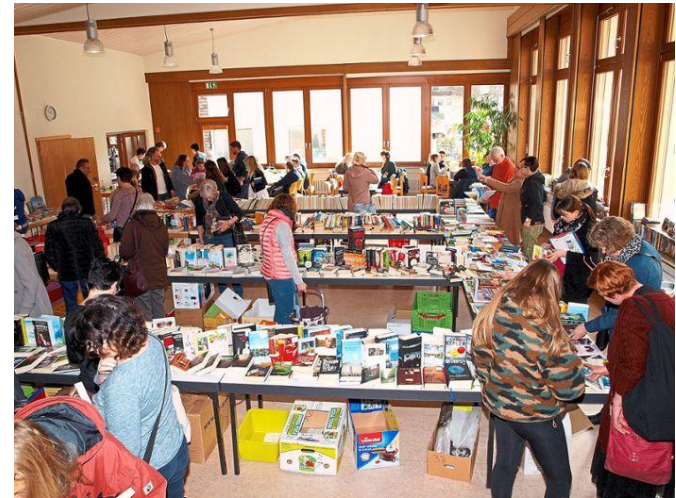
Gute Zusammenarbeit zwischen CVJM und Pusteblume beim alljährlichen Bücherflohmarkt im Gemeindehaus

Trotz der Zunahme von E-Books sind Bücher als Lesestoff nach wie vor gefragt. Das zeigte sich wieder einmal mehr beim schon traditionellen Calmbacher Bücherflohmarkt, veranstaltet vom Kinder- und Jugendförderverein "Pusteblume" in Zusammenarbeit mit dem CVJM Calmbach am 15.02.20 20 im evangelischen Gemeindehaus.